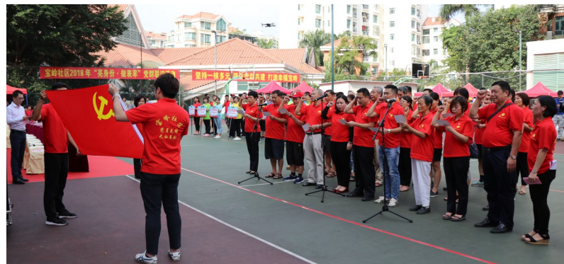
宝岭社区党员重温入党誓词。

本报讯(深圳侨报记者 张鹏 通讯员 江仕平)9月6日下午,南湾街道宝岭社区开展了一场形式活泼、主题鲜明的“亮身份·做表率”党群联谊活动,鼓励广大党员敢于亮出身份,让社区居民知晓党员就在群众身边,提醒党员注意党员形象,以实际行动当好表率做出榜样。