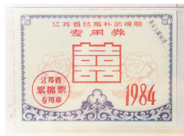
江苏结婚补助棉胎专用券