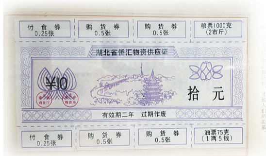
归国华侨专用票券