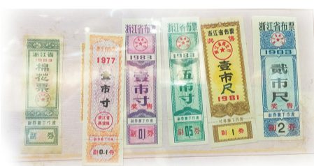
浙江省棉花票、布票

深圳是全国第一个取消粮票的城市,1994年全国各地基本取消粮票,票证时代彻底终结,深圳取消粮票的时间比全国早了10年。