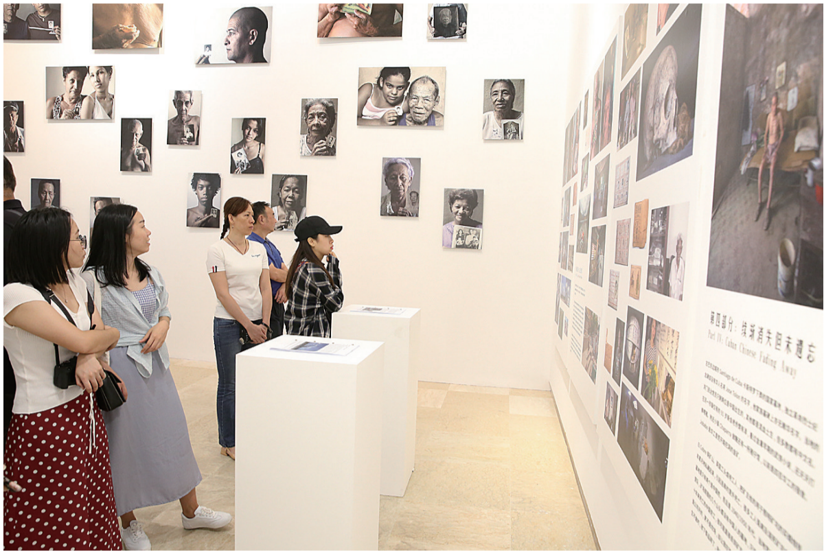
参展作品《隐匿的记忆》。

“身份认知与文化归属”、“过程、经历与艺术思考”、“族裔身份与文化记忆”、“海外中国”与“本土中国”的连接与错位”、“多元文化与少数族裔文化权利”……从单一文化认同到多元文化认同,从文化心理到文化取向的双重性表述,从道德观念到行为准则及生活方式等等,“海外华人艺术”形成了新的文化生态学,也生成了具有新的文化特质的艺术方式与现象。9月15日,第三届海外华人艺术家邀请展“别处/此在:海外华人艺术抽样展”在何香凝美术馆展出,参展艺术家、评论家、独立策展人,以及国内知名美术馆、美术学院专家学者,共聚何香凝美术馆,共同关注海外华人艺术现象,向观众解读海外华人艺术的故事。