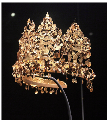
蒂拉丘地出土的黄金王冠

● 贝格拉姆城址: 地处阿富汗东北部的帕尔万省,位于兴都库什山脉南麓,西南距喀布尔约60公里。出土了来自当时罗马帝国的石膏制品、青铜器、玻璃器以及来自印度地区的象牙雕、青铜器,无声讲述了贵霜帝国鼎盛与衰亡的神秘传说。