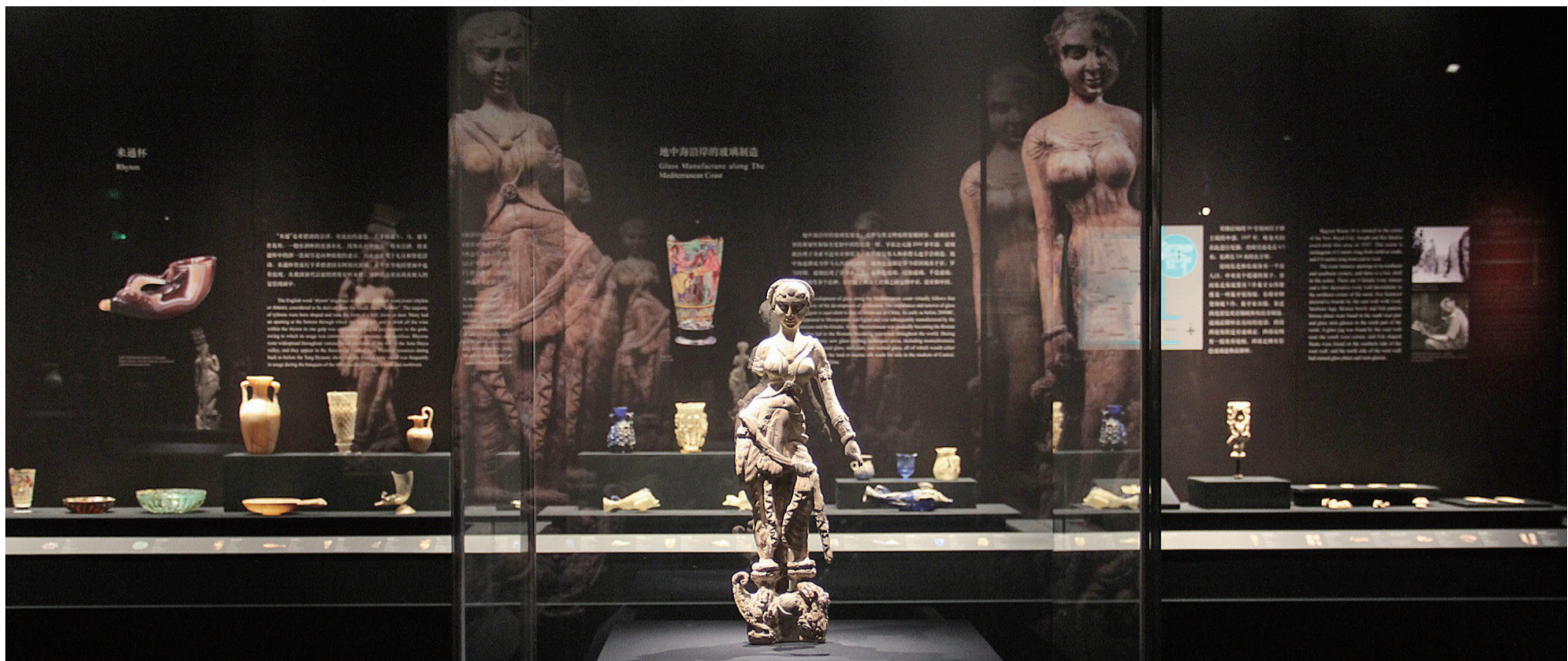
贝格拉姆城址出土的石膏制品、青铜器、玻璃器皿。