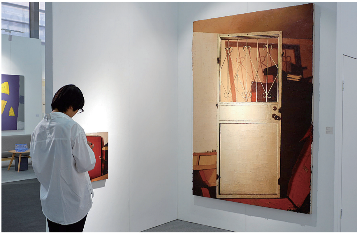
“一扇门”带来了沉思。

2018“艺术深圳”期间,广深港地区各个重点艺术机构亦将推出“中国当代摄影40年”“辛夷坞——关于当代精神美学的阐述”等重要展览和活动,形成艺术事件发生的湾区联动效应,为湾区当代艺术氛围的强化和收藏习惯的养成创造更为积极有利的条件。