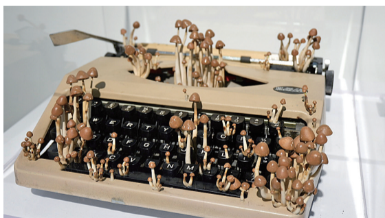
长满蘑菇的打字机。