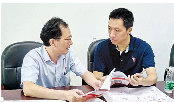
新区安监局工作人员(右)到企业宣传《安全生产主体责任规定》。

营单位主要负责人作为本单位安全生产第一责任人,通过签订《深圳市生产经营单位主要负责人安全生产主体责任承诺书》,承诺履行建立安全生产责任体系、保障安全生产投入、开展安全生产培训、实施风险分级管控与隐患排查治理、完善设备设施与作业安