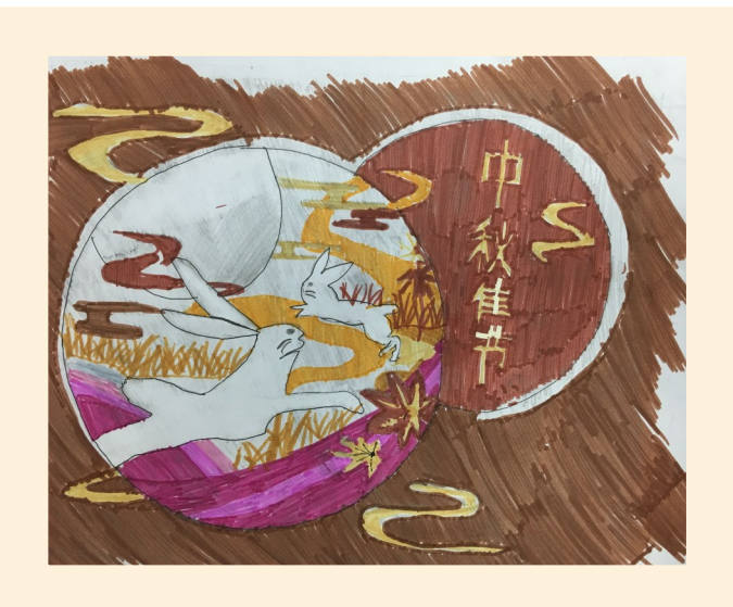
玉兔 平湖中心小学六(1)班 杨涛瑞 指导老师:蔡敏如