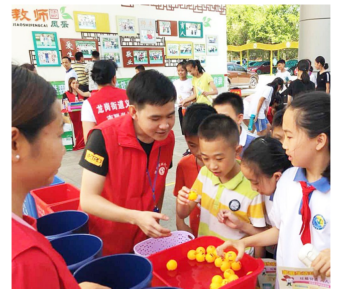
开展垃圾分类宣传活动。

特别值得一提的是,区城管局抓党建,以党建引领激励党员干部新时代干出新业绩。充分发挥局党组核心引领作用,组织开展“大学习、深调研、真落实”活动,在大学习的基础上,聚焦城市管理突出短板、市民关注的热点难点问题以及制约城市管理深层次发展的体制机制问题,开展“市容市貌发展不平衡不充分”等9个专题课题研究。全面加强基层党组织建设,组织开展了“我是共产党员,我当环卫工人”“台风过后清扫忙,齐心协力筑家园”“我当网格员”等一系列主题党日,充分发挥党员的先锋模范作用,把下属支部打造成坚强的战斗堡垒,为各项工作顺利推进提供保障。