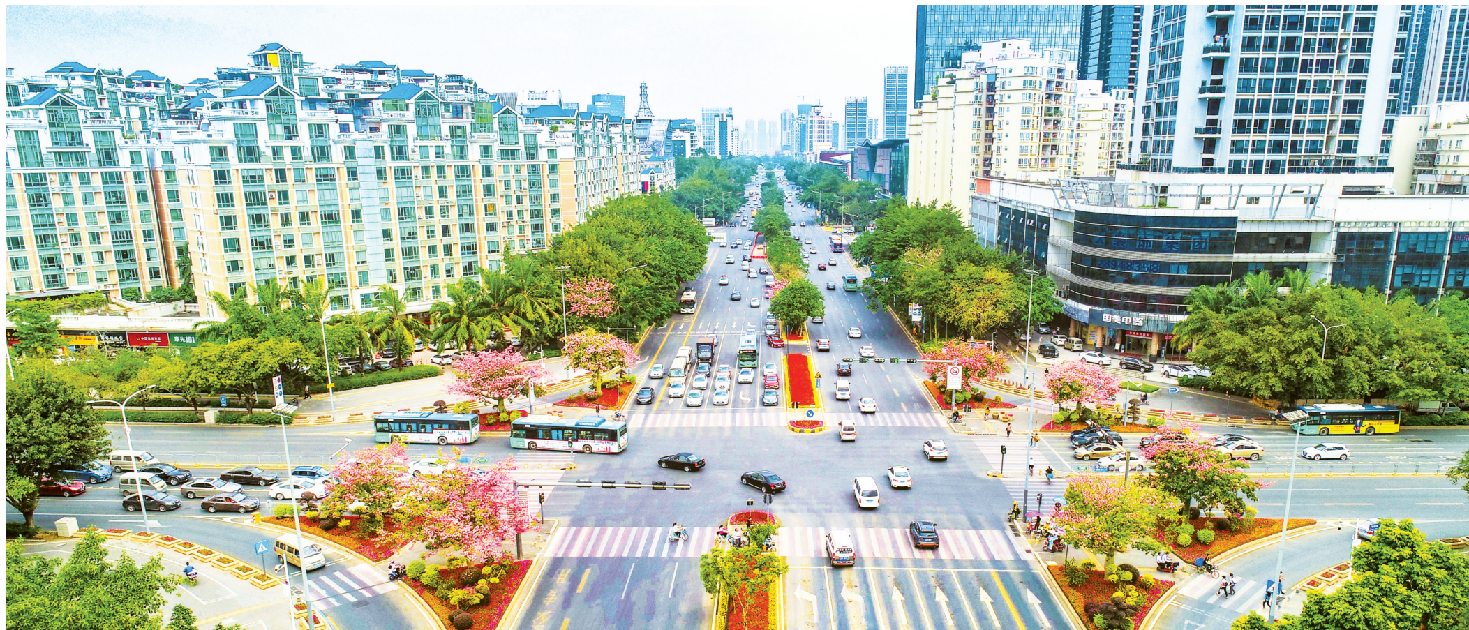
花团锦簇的龙翔大道花卉景观大道。

“我们去龙翔大道走走!”近来,龙翔大道成为龙岗市民交口相传的休闲景观。白天,这里是满目的繁花绿草;入夜,流光溢彩的灯光夜景长廊如梦如幻。不仅是龙翔大道,社区公园、花漾街区、精品绿道……人们发现龙岗仿佛一夜之间多了很多休闲的新去处,大家交口称赞:过去这一年,龙岗的变化真是太大了!