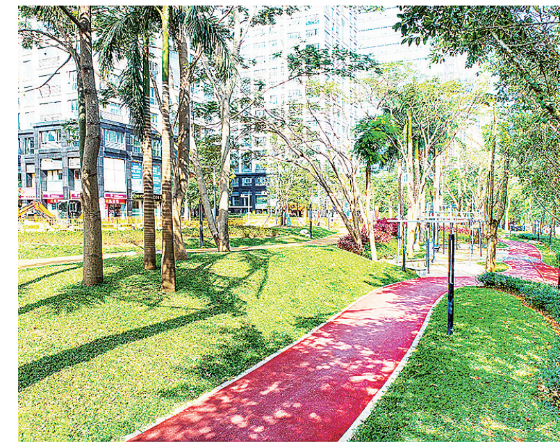
环境优美的珠江广场社区公园。