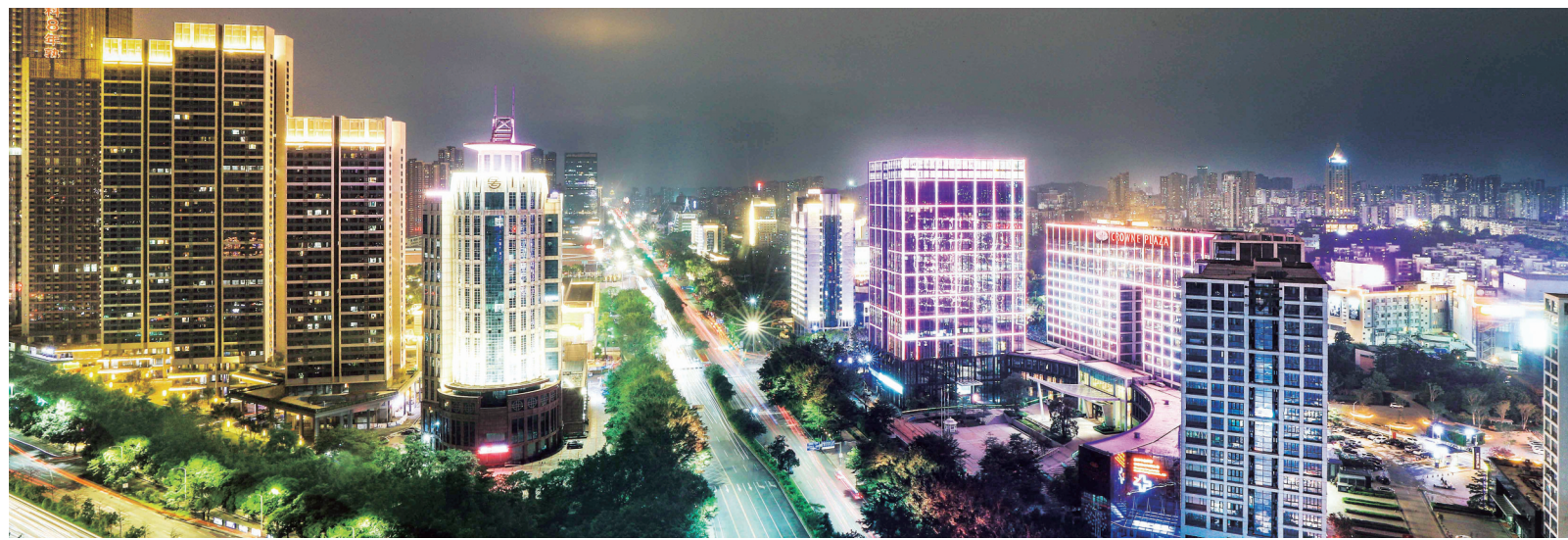
流光溢彩的龙翔大道灯光夜景。

升级改造134座市政公厕,升级改造235座垃圾转运站,完成新建改造6个公园,完成10条道路慢行照明提升工程,开展生活垃圾分类和减量工作……2018年,龙岗区城管局负责实施的民生实事均已圆满完成。其中,公园建设项目和垃圾分类工作超额完成任务,新建改造公园12个,垃圾分类全区普及率达到100%,民生至上,品质优先,市民群众深切感受到环境品质提升所带来的方便和惬意,对龙岗区环境满意度不断提升。