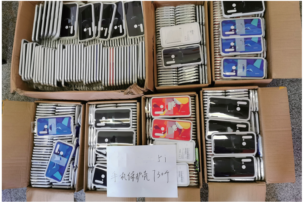
龙岗警方缴获的假冒品牌手机壳。

的扫描件，皮套上的官方LOGO、防伪字串彰显其“正品”身份。刮开防伪涂层，会显示一个验证二维码，手机扫描二维码可进入一个验证网站，输入手机上的防伪字串，即显示产品为正品。这让很多消费者确信自己购买的产品是正品无疑。然而，经过警方调查验证，这里的防伪二维码、验证网页也是假的。