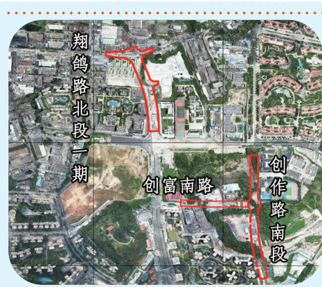
有待打通的创富南路等3条断头路。