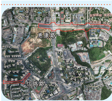
“断头路”惠康路B段已打通。

据了解，翔鹤路北段、创作路南段、创富南路这三条“断头路”位于布吉木棉湾社区、可园社区、罗岗社区辖区内，涉及该片区数万居民出行。其中，翔鹤路北段一路向北直通龙岗大道，横穿龙岗大道与布吉街道办旁的吉政路相连。一旦打通，片区内居民可以驱车一路北上到龙岗大道，进入布吉中心区域。目前，居民则要通过片区内的小道绕行至白鸽路，经过深圳东站进入龙岗大道，才能抵达中心区域，增加了出行时间。创作路南段与可园学校一墙之隔，创作路南段和创富南路是龙岗区第二人民医院（即布吉医院）新选址的唯一进出道路，这两条“断头路”打通后，对缓解可园学校交通压力、改善龙岗区第二人民医院周边交通环境具有重要意义。三条“断头路”力争今年年底建成通车。