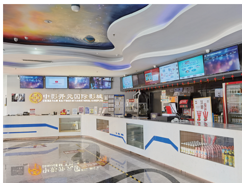
开元国际影城为重新开门迎客做足准备。