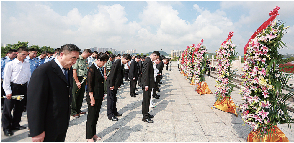
参加仪式的人员向革命英烈默哀。

上午9点30分，向龙岗人民革命烈士纪念碑敬献花篮仪式正式开始。随着《义勇军进行曲》奏响，全场一同高唱中华人民共和国国歌。国歌唱毕，全场肃立，向为中国人民解放事业和共和国建设事业英勇献身的烈士默哀。随后，少先队员代表献唱《我们是共产主