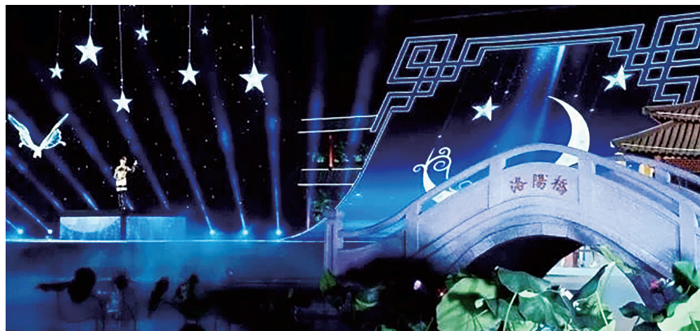
LED异形屏舞台亮相央视中秋晚会。

本报讯（龙岗融媒首席记者 张祥 通讯员 陈杰）2020年央视中秋晚会，再次惊艳全球观众！1000平方米光祥LED显示屏，化身诗情画意的艺术装置，勾连古今，虚实隐现。10月1日晚，“神都月，中华情”2020庚子年总台央视中秋晚会在洛阳应天门华丽呈现。光祥科技作为中央广播电视总台特定合作的LED显示屏供应商，在中秋之夜，和央视一起为世界人民奉上高水准的文艺演出。