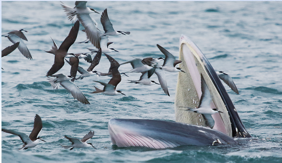
国家一级保护动物布氏鲸现身大鹏湾,引起社会各界广泛关注。

本报讯(深圳侨报记者 李苑 通讯员 杨建超 吴依妮)近期,在大鹏湾出现的国家一级保护动物布氏鲸(昵称“小布”)引起了社会各界广泛关注,大鹏新区良好的海洋生态、丰富的鱼群都让“小布”安心地大口鲸吞“干饭”。