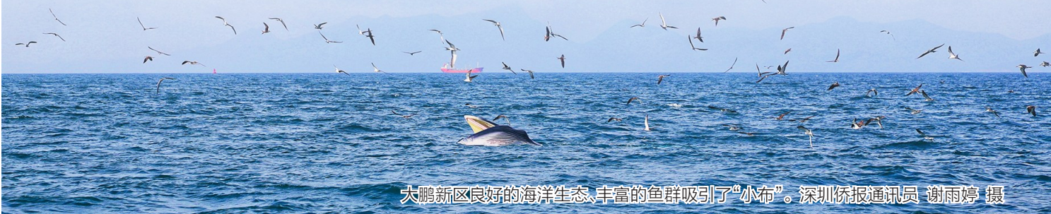
大鹏新区良好的海洋生态,丰富的鱼群吸引了“小布”。

建议大鹏新区与香港渔农自然护理署和广东省大亚湾水产资源自然保护区等部门加强联动,及时掌握和共享布氏鲸相关信息及去向,有利于联动做好保护工作。