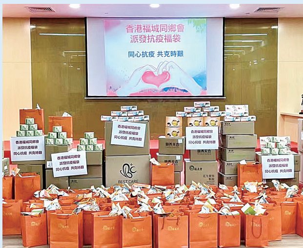
香港福城同乡会筹备3100余份抗疫福袋。

本报讯（深圳侨报记者 谢青芸 通讯员 徐志 高慧）近日，香港第五波疫情来势汹汹，关键时刻，龙华区统一战线坚决落实习近平总书记对香港疫情“三个一切、两个确保”的重要批示精神，纷纷行动起来，用不同方式守望相助、同舟共济助力香港抗疫，传递出深港同根的冬日温情。