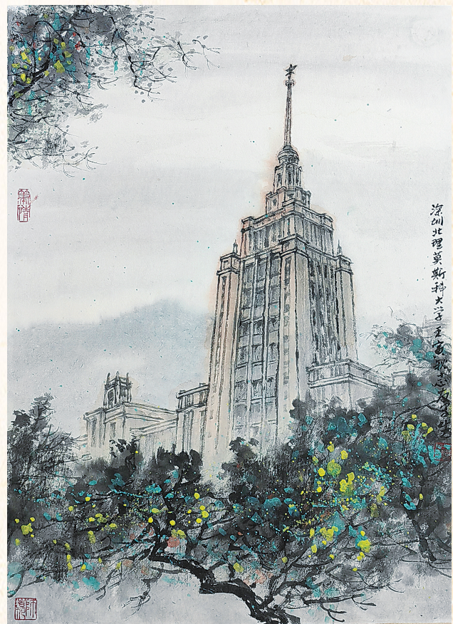
深圳北理莫斯科大学